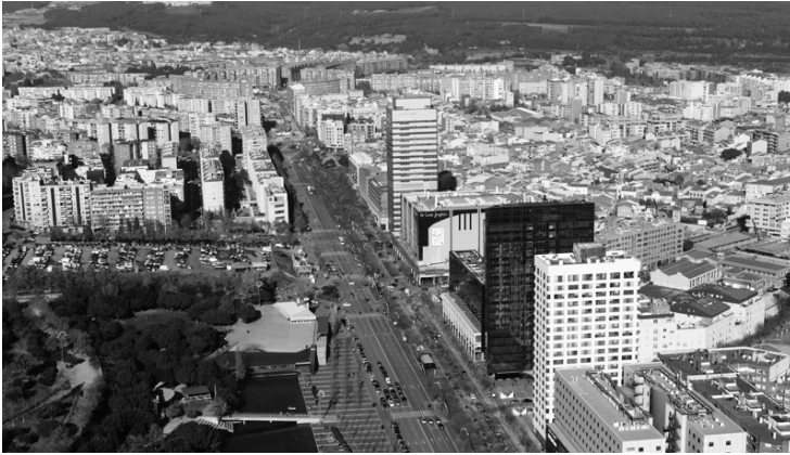
L'Eix Macià i el Parc de Catalunya, una nova centralitat de Sabadell endegada en els primer anys 1990.

immobles, tipus oficina, en serveis lligats al món manufacturer i als serveis en general, i que no tots radiquen a la capital. Terrassa, Sabadell o Mataró han estat alienes a aquest fet de modernització. Tot i algun intent, com és el cas de l'Eix Macià de Sabadell, en conjunt les oficines no han passat de les localitzacions antigues, o aquestes ciutats no han sabut generar sòl per a aquesta activitat, una activitat que existeix i que no és monopoli de la capital catalana. Ser ciutats de més de dos-cents mil habitants té avui un preu d'envelliment, que no paguen les altres ciutats com Granollers o Sant Cugat, o Barcelona per ser capital. En la cursa econòmica, paradoxalment, la inèrcia històrica hauria estat un factor més negatiu que ser capital recent, o una capitalitat comercial hi hauria estat més sòlida.