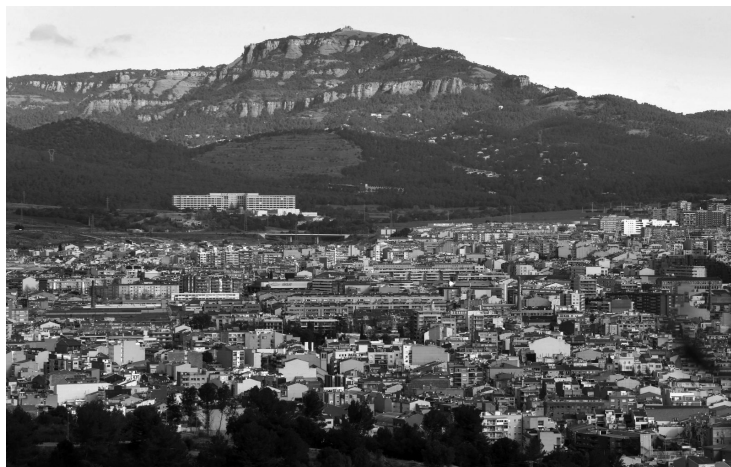
Vista de Terrassa a redós de Sant Llorenç del Munt, que constitueix un fort element d'identitat per a la ciutat.

Ponències Revista del Centre d'Estudis de Granollers, 28 (2024), 7-41