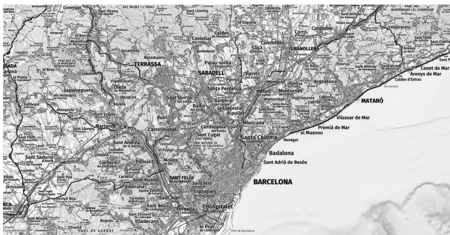
Mapa 1. L'àmbit del Vallès respecte de Barcelona, amb els principals nuclis urbans i l'eix de l'AP-7, centre de la vall prelitoral.

En els valors d'oficines cal esmerçar-hi una atenció especial. Tendim a pensar que això és cosa de les grans capitals, però resulta que Granollers dobla en sostre per habitant les dues capitals occidentals i s'acosta a Barcelona, i Sant Cugat duplica Barcelona. Caldria reconèixer que avui l'activitat econòmica no són només fàbriques o magatzems, sinó que hi ha molta activitat en