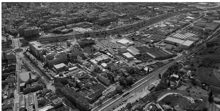
Vista de Granollers amb el polígon Jordi Camp que s'estén a l'altra banda del riu Congost en primer terme.

La configuració laboral mostra el mateix camí que l'evolució del sostre construït, vista anteriorment, en una realitat de desaparició de les ciutats industrials tèxtils, i en contrast amb l'evolució d'altres municipis. L'obertura laboral fa que totes les ciutats absorbeixin ciutadans exteriors que hi arriben a treballar. I aquest valor seria signe de capitalitat i fet metropolità. Amb dades del període 1991-2021, aquesta dinàmica sembla imparabile, si comparem el nombre de treballadors forans sobre els residents que treballen al municipi. Una ciutat com Terrassa passa del 23 % inicial al 43 %, com ara Mataró (del 23 % al 44 %); Sabadell, més oberta, canvia del 35 al 61 %, amb valors semblants a la ciutat de Barcelona (del 46 al 60 %). Granollers, però, passa del 99 % al 157 %; és a dir, la ciutat tenia, de partida, un treballador forà per cada un de propi que es quedava, i ara ja és més d'un i mig de forà. Sant Cugat del Vallès, si ja era d'obertura plena, amb un 133 % inicial, el 2011 ja era del 221 %: més de dos treballadors forans per cada un de local que es mantenia al municipi. La dissolució del marc local com a àmbit laboral queda molt palesa en la dinàmica dels darrers anys, un ritme que no ha estat homogeni, sinó amb centres molt àgils, com és el cas de Sant Cugat.